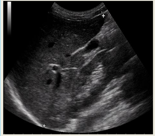
Figura 3. Ultrasonido Abdominal: ecogenicidad heterogénea. Lóbulo hepático derecho 183mm. Hepatomegalia.