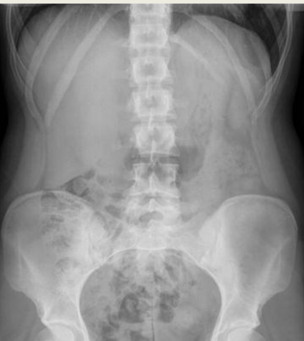
Figura 2. Rx de abdomen simple de pie: hepatomegalia.